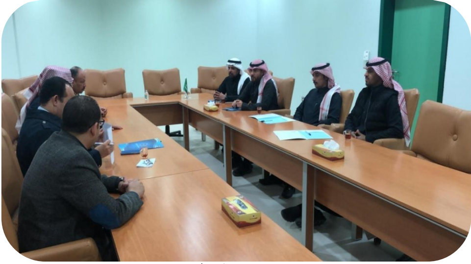
زيارة جامعة حائل