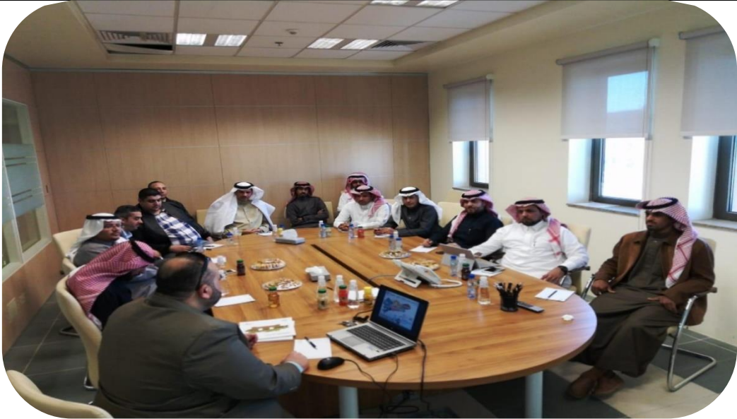
زيارة جامعة الملك فيصل