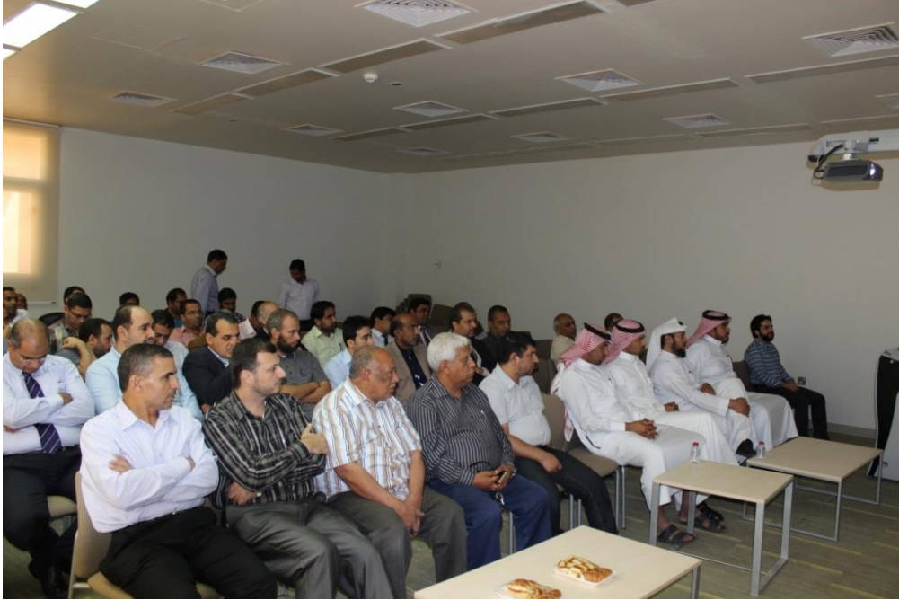
د- برنامج الإرشاد الأكاديمي